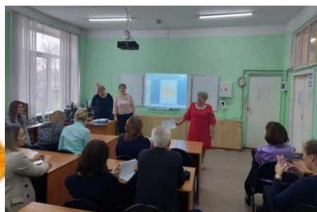
Школьная творческая киностудия «Взгляд»