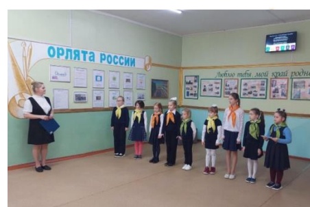
Патриотические проекты «Орлята России», «Эколята», «Юные любители искусства»