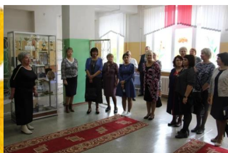
Краеведческий клуб «Изучая, познаю, познав, продолжаю славную историю Отечества»

На семинарах наши дети и педагоги делились успешным опытом учебной и воспитательной работы. Здесь были представлены новые формы, практики инновационного педагогического опыта воспитания гармонично-развитой и социально-ответственной личности на основе духовно-нравственных ценностей, исторических и национально-культурных традиций Российской Федерации, клубы интереса и творчества