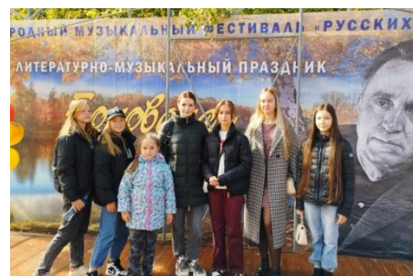
Боковский вернисаж «Люблю тебя, мой край родной»

Главная цель – повышение эффективности воспитания детей и молодежи в современных условиях, обмен передовым опытом.