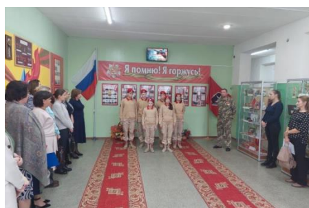
Юнармейский патриотический военно-спортивный клуб «Рысь»