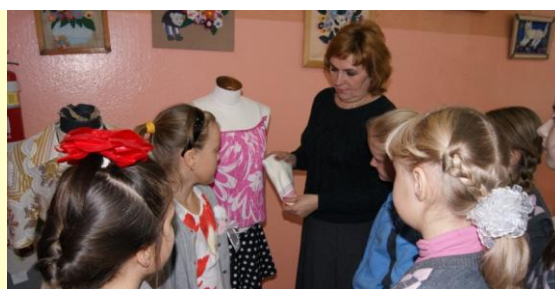
Беседа о культуре внешнего вида