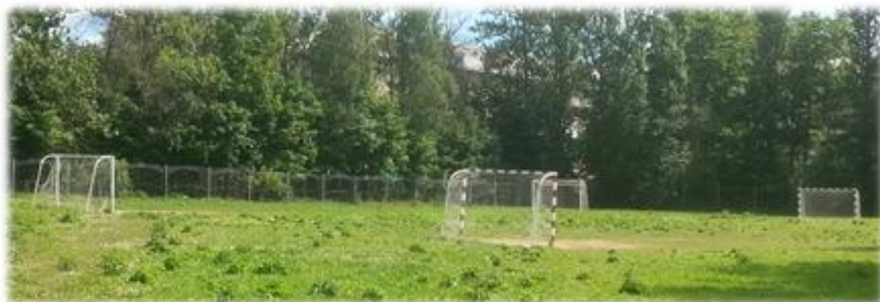
Стадион (спортивное поле с естественным покрытием)