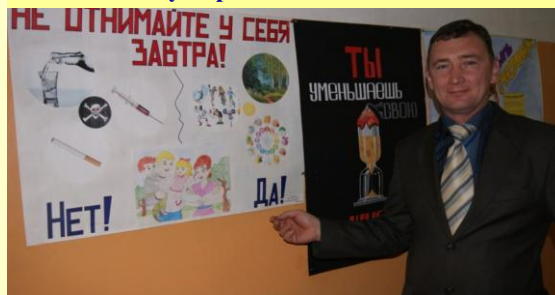
Вести с урока ОБЖ о вредных привычках