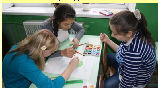
Рисуем рекламный плакат