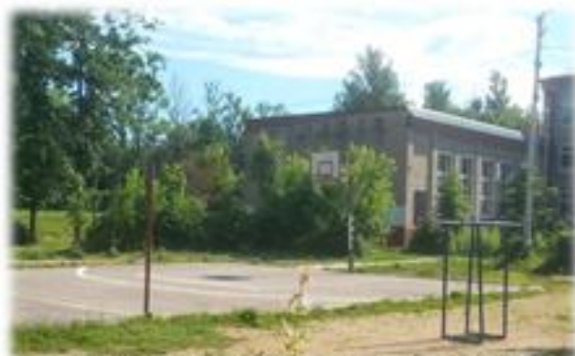
Баскетбольная и волейбольная площадка