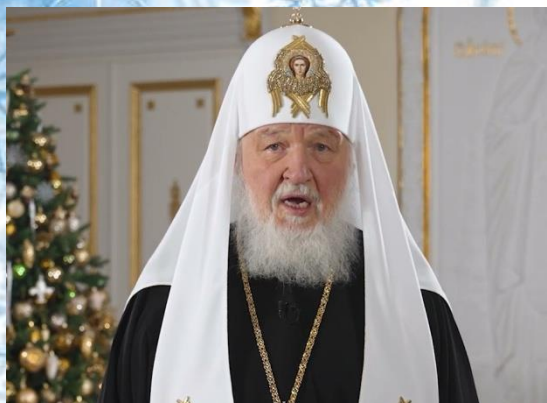
Обращение Патриарха Кирилла